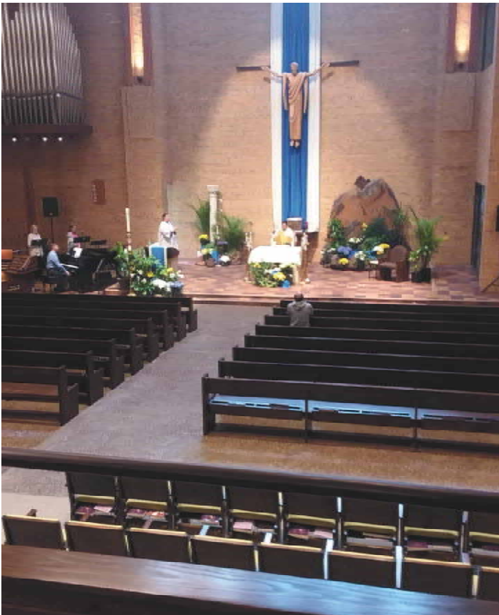
The church was almost empty for Easter 2020. We are grateful to be able to gather with so many of you this year!